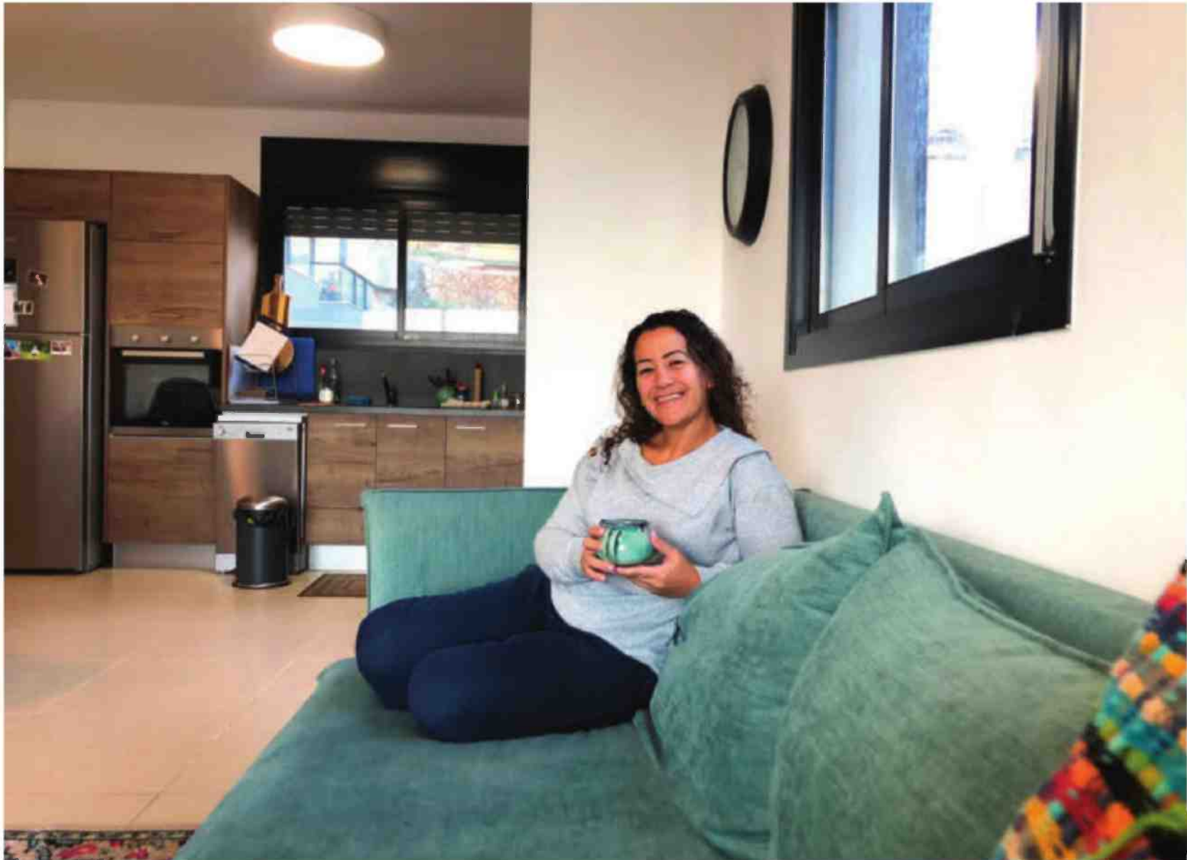
זרחיהו בדירתה בוואדי סאליב שבחיפה. נוף לים, חדר כושר, מועדון דיירים וחניה פרטית בשכר דירה קבוע

40 שכ"ד בראש שקט בעקבות המשבר רבים זונחים את חלום קניית